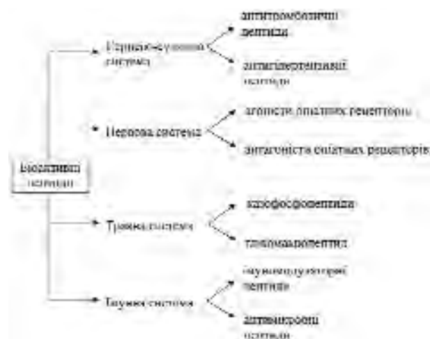
Рис. 2. Функції біоактивних пептидів із казеїнів [19]

пептиди впливають на функцію різних фізіологічних систем організму (рис. 2). Зокрема, було ідентифіковано агоністи та антагоністи опіатних рецепторів, інгібітори ангіотензинперетворювального ензиму, антитромботичні пептиди, імуномодуляторні пептиди, біоактивні фосфопептиди, пептиди, які пригнічують розвиток патогенних мікроорганізмів. У 1991 р. нами було встановлено можливість утворення таких біоактивних пептидів з протеїнів казеїнового комплексу молока під дією ензимів протеолітичних систем лактококів і протеаз, що їх використовують у виробництві ферментованих молочних продуктів [18]. Дослідження біоактивних пептидів з казеїнів активно проводять і в наш час. Постійно поповнюється база даних щодо біологічно активних пептидів, які утворюються в процесі перетравлювання казеїнів, відкрито нові види біологічної активності (антиканцерогенна дія, стимуляція синтезу ДНК, антивірусна дія і т. д.) [19–22].