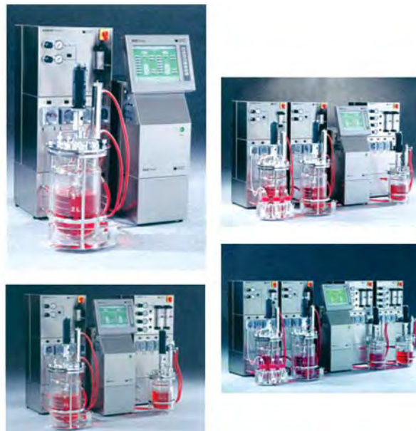
Рис. 2. Модифікації лабораторних ферментерів BIOSTAT® B-DCU

Лабораторний ферментер з робочим об'ємом від 0,5 до 10 л, що автоклавується, призначений для культивування мікроорганізмів і клітинних культур. Він є вдосконаленою модифікацією ферментера Biostat B. Цю модель випускають як з однією ємністю, так і у вигляді подвійної, потрійної і четвертої установок (установки твін, тріпл і кватро; рис. 2).