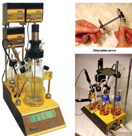
Рис. 10. Лабораторний ферментер Minifor

очищується завдяки еластичності матеріалу, з якого її виготовлено, і тому в отворі не затримуються будь-які відкладення (рис. 11).