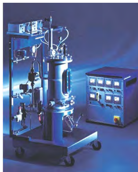
Рис. 7. Лабораторний ферментер NLF

Ферментери серії NLF вважають оптимальним зв'язком між лабораторією і виробництвом. Система ферментера ґрунтується на добре відлагодженому модульному принципі конструкції Bioengineering (рис. 7).