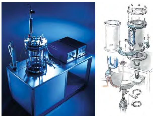
Рис. 8. Лабораторний ферментер L1523 у скляному і металевому варіантах

Це — ферментер класичного типу, призначений для виконання широкого кола завдань, зокрема для вирощування прокариотів і клітин тварин. Можливі два варіанти діаметрів: 150 і 200 мм. Має низьку вартість. Випускають цей ферментер з 1972 року, але він і досі користується попитом (рис. 8).