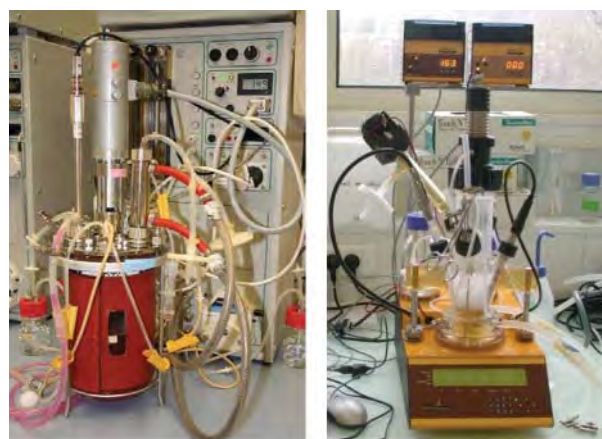
Традиційний лабораторний біореактор