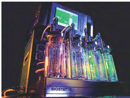
Рис. 5. Лабораторний ферментер Biostat Q

Це — мультиферментаційна система, яку спеціально розроблено для серійних експериментів і яка спрощує перехід від колб до робочого ферментера (рис. 5).