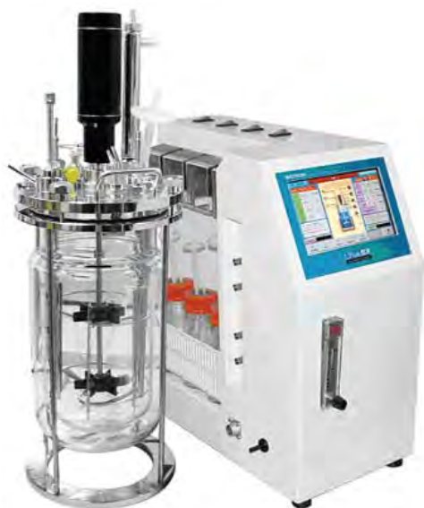
Рис. 9. Лабораторна система Liflus GX

(Single Vessel) застосовують для роботи з мікроорганізмами (бактерії, дріжджі, гриби тощо). Систему можна використовувати для простого періодичного культивування і для періодичного культивування з підживленням за допомогою перистальтичних насосів. Є датчики контролю, які звичайно застосовують у лабораторних ферментерах. Число обертів перемішувального пристрою регулюється в межах 50–1200 хв -1 .