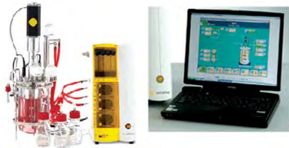
Рис. 1. Лабораторний ферментер BIOSTAT®A plus

Цей компактний ферментер/біореактор, що автоклавується, має об'єм 1, 2 і 5 дм 3 . Його спеціально розроблено для застосування в учбовому і дослідницькому процесах. Є надзвичайно простим і зручним у роботі. Концепція єдиного корпусу з інтегрованим обладнанням для вимірювання і керування, насосами, системами температурного контролю, подачі газу і мотором дає змогу економити цінний простір на лабораторному столі (рис. 1).