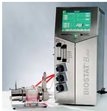
Рис. 4. Лабораторний ферментер Biostat® B plus RBS

Клітини тварин багато в чому відрізняються від прокаріотичних і грибних клітин: вони повільніше ростуть, у них велика чутливість до поранення і пухирців повітря. Ці властивості клітин впливають на конструкцію біореакторів, особливо на системи перемішування і аерації, які під час роботи не повинні створювати стресових умов для