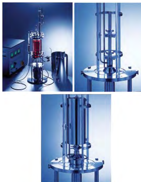
Рис. 6. Лабораторний ферментер KLF

KLF — найменший з ферментерів серії CSTR, який можна стерилізувати in situ . Його конструкція дозволяє простими способами встановлювати зв'язок з будь-якими модулями Bioengineering (приладами і контрольними системами) і збільшувати кількість їх у будь-який час, що є першим кроком у масштабуванні багатьох процесів (рис. 6).