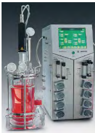
Рис. 3. Лабораторний ферментер BIOSTAT® B plus

Змінні місткості для мікробних клітинних культур готові до застосування «прямо з упакування». Ферментер є вдосконаленою модифікацією Biostat B-DCU (рис. 3).