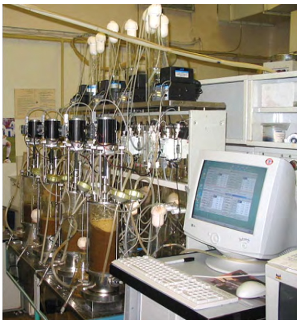
Рис. 13. Комплекс ферментаційний КФ модифікований QUADRUS

На рис. 13 зображено комплекс КФ модифікований QUADRUS (у разі потреби ферментер КФ випускають і в одиничному виконанні).