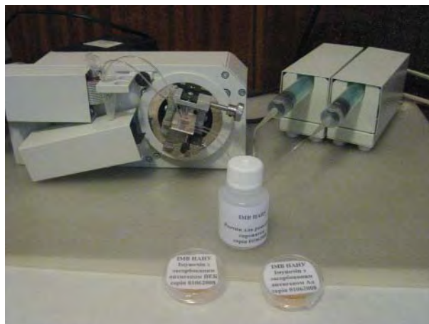
Рис. 1. ППР-спектрометр «ПЛАЗМОН 6»

измерение, запись полной ППР кинетической зависимости, а также минимальное время одного измерения: 0,2 с (режим slope).