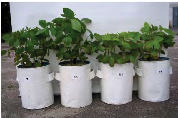
Рис. 3. Влияние инокуляции различными по активности штаммами Bradyrhizobium japonicum , проинкубированными с гомологичным лектином (SBA), на развитие растений сои (фаза бутонизации):

Азотфиксирующая активность клубеньков в значительной степени определяется симбиотическими свойствами микросимбионта и является одним из основных критериев эффективности симбиотической системы. Из данных табл. 3 следует, что, как и в случае с вирулентностью, прединкубация ризо-