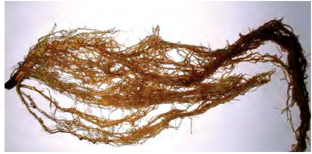
Рис. 4. Клубеньки, образовавшиеся на корнях растений сои, инокулированной активным штаммом Bradyrhizobium japonicum 6346 (начало плодообразования)

бий с лектином растения-хозяина приводила к увеличению общей нитрогеназной активности клубеньков, индуцированных активными штаммами ризобий (646 и 6346). Показатели удельной нитрогеназной активности клубеньков при внесении лектина в суспензии активных штаммов находились в пределах ошибки опыта или характеризовались тенденцией к снижению. Это указывает на то, что в условиях эффективного взаимодействия партнеров симбиоза увеличение общей нитрогеназной активности под влиянием лектина растения-хозяина происходит прежде всего за счет увеличения количества азотфиксирующих клубеньков (т. е. вирулентности ризобий), а не вследствие увеличения активности их нитрогеназного комплекса. Внесение лектина в суспензию малоактивного штамма 21110 и неактивного штамма 604к оказывало противоположный эффект и проявлялось тенденцией к снижению как клубенькообразования, так и азотфиксации.