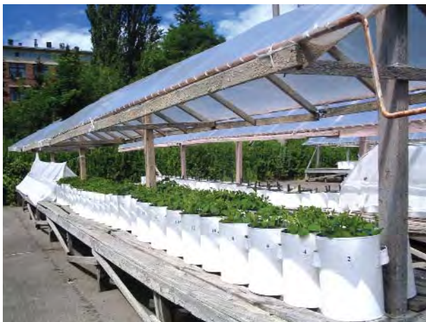
Рис. 1. Общий вид растений сои на вегетационной площадке (фаза 1-го настоящего листа)

Все результаты обрабатывали статистически, в таблицах представлены средние арифметические и их стандартные ошибки.