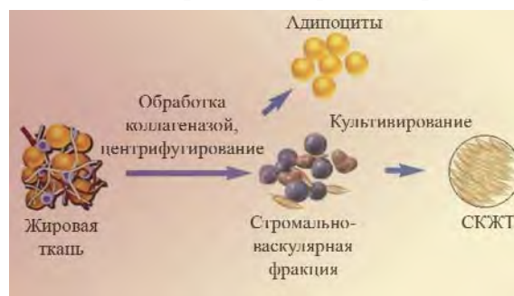
Рис. 1. Схема выделения стромальных клеток из жировой ткани

(СК), причем источником достаточно богатым — из 300 мл жира авторы получали от 10 до 20 \cdot 10^6 клеток, названных ими «СК обработанного липоаспирата» (processed lipospirite, PLA). Метод этих авторов, схематически приведенный на рис. 1, заключался в обработке липоаспирата коллагеназой (фрагменты жировой ткани инкубировали при 37 °С в 0,075% -м растворе коллагеназы типа I в течение 30 мин). Центрифугирование первичной суспензии приводило к ее разделению на две фракции. В верхнем светлом слое располагались адипоциты, а в осадке — клетки СВФ с примесью гемопоэтических клеток. Эритроциты удаляли с помощью инкубации в лизирующем растворе хлорида аммония, а другие гемопоэтические клетки, обладающие слабой адгезивной способностью, элиминировались при пассировании.